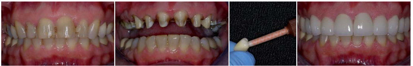
Abb. 1: Gesamtansicht eines Patienten vor der Behandlung. – Abb. 2: Präparationen. – Abb. 3: Einbringen von Maxcem™ Elite in Lava-Krone. – Abb. 4: Postoperative Gesamtansicht der zementierten Restaurationen.