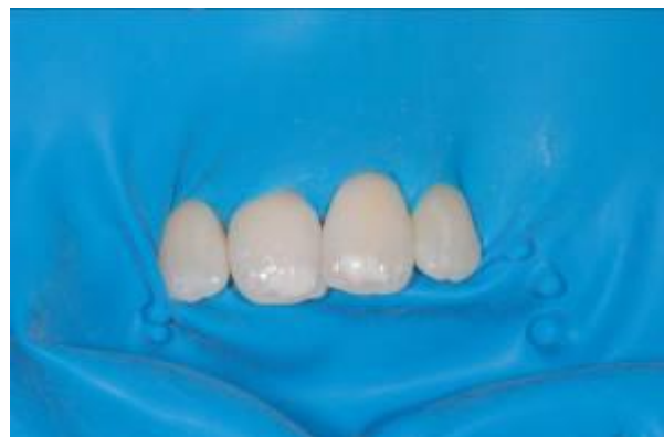
afb. 4: OptiDam™ voorbij de contactpunten