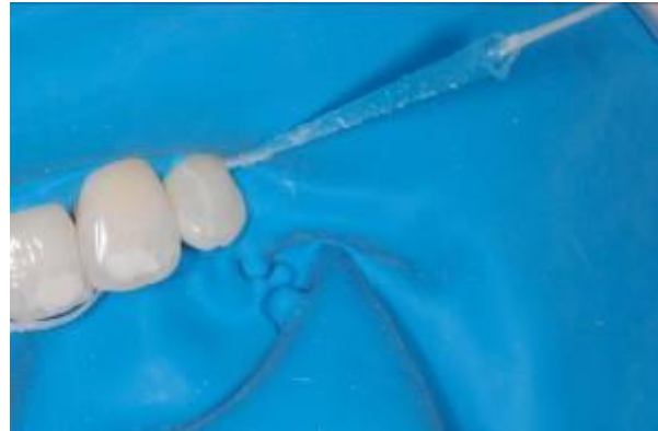
afb. 5: Fixafloss™: voor het fixeren van cofferdam