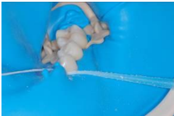
afb. 15: SoftClamp™ en OptiDam™ gecombineerd

2d) In het posterieure gebied kan OptiDam™ met Fixafloss™ worden vastgezet door deze gemakkelijk door het interproximale gebied te halen ( afb. 15 ). De vrije uiteinden kunnen daarna worden afgeknipt zoals besproken bij de procedure in het anterieure gebied.