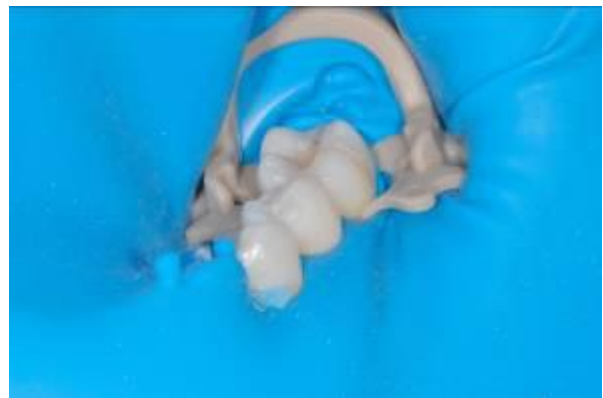
afb. 16: SoftClamp™, OptiDam™ en Fixafloss™

2e) Met OptiDam™ met zijn driedimensionale vormgeving en verminderde spanning kan een optimale en snelle toegang worden gekregen in het orale gebied. Samen met de toepassing van nieuwe fixeermogelijkheden zoals SoftClamp™ en Fixafloss™ is KerrHawe erin geslaagd een werkelijke doorbraak in cofferdamtechniek te presenteren ( afb. 16 ).