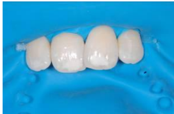
afb. 7: Fixafloss™: het afknippen van de uiteinden