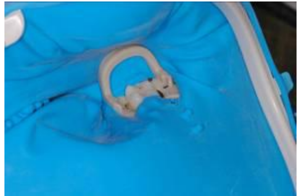
afb. 14: SoftClamp™ op een eerste molaar onder

2d) In het posterieure gebied kan OptiDam™ met Fixafloss™ worden vastgezet door deze gemakkelijk door het interproximale gebied te halen ( afb. 15 ). De vrije uiteinden kunnen daarna worden afgeknipt zoals besproken bij de procedure in het anterieure gebied.