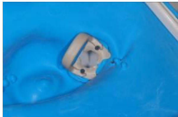
afb. 12: SoftClamp™: autoclaveerbare klem

2b) Makkelijk vooraf plaatsen van de unieke, metaalvrije en universele SoftClamp™ in de OptiDam™ ( afb. 12 ).