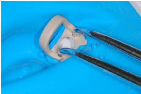
afb. 13: SoftClamp™: compatibiliteit van de tang