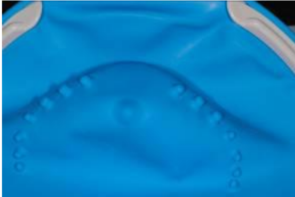
afb. 9: OptiDam™: 3D-shape met nippels

2a) Voorbereiden van OptiDam™ posterior: een voorgevormde 3-dimensionale cofferdam met een voorgevormde nippels ( afb. 9 ), welke gemakkelijk met een schaar kunnen worden afgeknipt ( afb. 10 ), waardoor wederom, zonder gebruik te hoeven maken van een cofferdampunch, goede openingen ontstaan ( afb. 11 ).