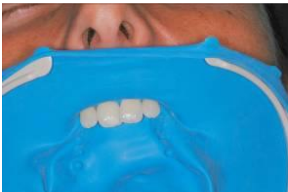
afb. 3: OptiDam™ met autoclaveerbaar frame