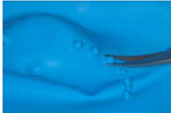
afb. 10: OptiDam™: makkelijk verwijderen van de nippels