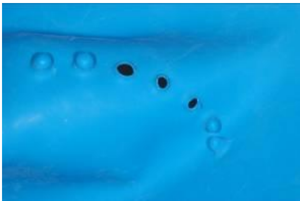
afb. 11: OptiDam™: nippels zijn afgesneden